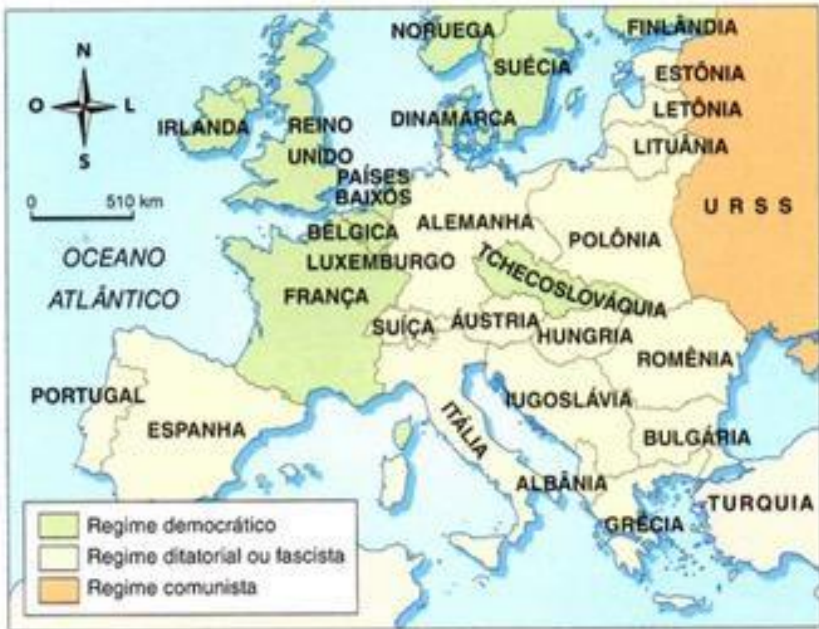
A Europa em 1939.