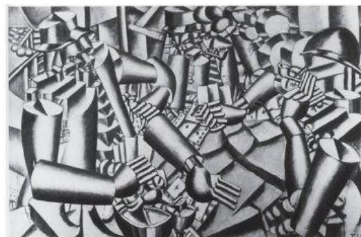
LÉGER, F. Soldados jogando cartas. 1917. FARTHING, S. Coleção Grandes Artistas. Rio de Janeiro: Sextante, 2009.

3 - 1. Nós queremos cantar o amor ao perigo, o hábito da energia e da temeridade. 2. A coragem, a audácia, a rebelião serão elementos essenciais de nossa poesia. 3. A literatura exaltou até hoje a imobilidade pensativa, o êxtase, o sono. Nós queremos exaltar o movimento agressivo, a insônia febril, o passo de corrida, o salto mortal, o bofetão e o soco.